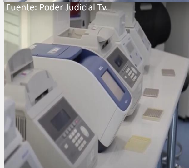
REGISTRO NACIONAL DE ADN LA HUELLA GENÉTICA DE MILES DE CONDENADOS

“La importancia de contar con un registro de este tipo tiene un valor incalculable para el descubrimiento de la verdad y el cumplimiento de la justicia”